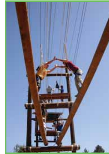
פארק חבלים באריאל

תעודה: לבוגרים שיעמדו בהצלחה במטלות הקורס, במבחן עיוני ובתרגיל מנהיגותי בשטח, תוענק תעודת הסמכה של מנחה סדנאות שטח בשיטת Outdoor Education/Training מטעם המכללה האקדמית בוינגייט.